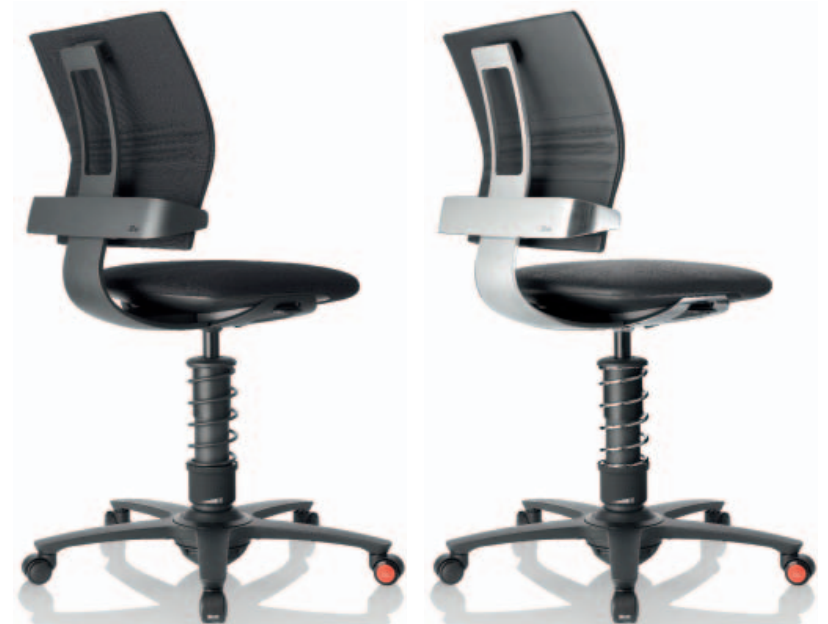
3Dee , Aluminium schwarz