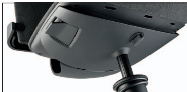
Individuell: Lehnengegendruck & Sitzhöhe

*Sitzhöhe gemessen mit 65 kg Normbelastung.