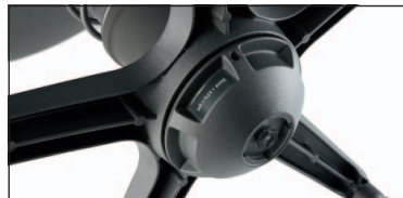
Einstellbar: seitliches & vertikales Schwingen